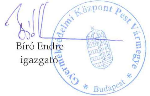
Bíró Endre igazgató